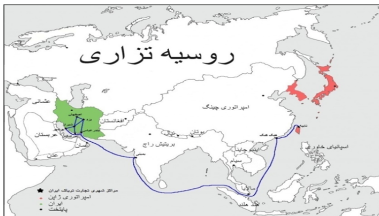
نقشه ۱. مسیر صادرات تریاک ایران به فرمانداری تایوان تا پایان قرن نوزدهم میلادی (قرن سیزدهم ق.). منبع نقشه قرن نوزدهم آسیا: (اووری، ۱۳۹۱: ۱۰).

حمایت وزارت خارجه را به کمک تیمسار فوکوشیما یاسوماسا دریافت داشت (یوناگا، ۱۳۹۲: ۳۹-۴۲). در سفرنامه‌ای که وی برای روزنامه کوکومین (Kokumin) فرستاد حرفی از تجارت تریاک زده نشده است. این مهم باتوجه به گستردگی و اهمیت کالای فوق نشان بر تلاش جهت مخفی نگاه داشتن مأموریت داشت. گزارش محرمانه (امروز غیرمحرمانه) تویوکیچی در آوریل ۳۳ میجی/۱۹۰۰م/۱۳۱۷ق به فرماندار جدید تایوان کوداما گنتارو (Kodama Gentaro) تقدیم شد که موضوع متن زیر، جهت بررسی در مقاله حاضر است. بجز بنادر بوشهر و بندرعباس میزان اندکی تریاک از طریق محمره به اروپا صادر می‌شد. البته باید گفت علاوه بر راه دریایی، میزان اندکی نیز از راه شیراز به سامسون سپس ترابوزان و از آن‌جا به قسطنطنیه می‌رسید که بندری به سوی اروپا و آمریکا بود. در کل می‌توان گفت صادرات سالانه تریاک ایران بین ۴۰۰۰ و ۵۰۰۰ صندوق بود. از آن‌جایی که دولت چین وارد کردن تریاک را منع کرده بود و ورود تریاک از هندوستان به این کشور دشوار شده بود، چین به طور تدریجی کشت تریاک را درون مرزهای خود تشویق کرد تا جلوی ورود تریاک هند را بگیرد (همان: ۱۸۵-۱۸۶). علی‌رغم تمام تمهیدات از جمله تأسیس اداره تریاک، این امر درآمد دولت فرمانداری هندوستان را در سال ۱۸۹۹م/۱۳۱۷ق را به نصف سال ۱۸۸۹م/۱۳۰۷ق رساند (همان: ۱۸۸). بنابر آنچه تا به حال در مقاله گفته شد می‌توان نقشه زیر را برای مسیر صادرات تریاک از ایران به فرمانداری ژاپنی تایوان ارائه داد: