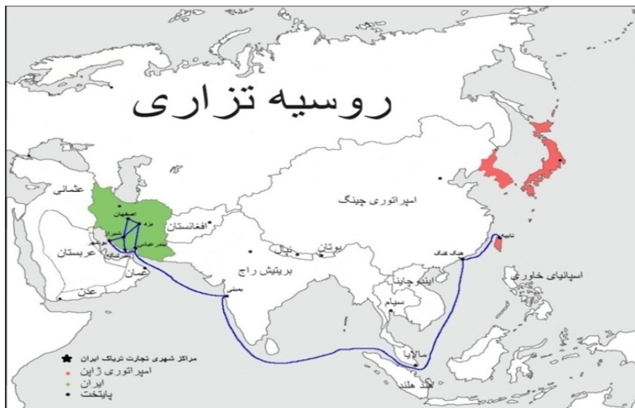
نقشه ۱. مسیر صادرات تریاک ایران به فرمان‌داری تایوان تا پایان قرن نوزدهم میلادی (قرن سیزدهم هجری قمری)

طبق نقشه بالا تریاک اصفهان از طریق مراکز اصلی تولیدی و تجاری یا به یزد می‌رفت تا عملیات بیش‌تری بر آن انجام شود و یا مستقیم به شیراز صادر می‌شد. محصول آماده‌شده در یزد به بندرعباس و شیراز فرستاده می‌شد. شیراز نیز محصول خود را به بندر لنگه و بندر بوشهر، مرکز صادرات ایران، ارسال می‌کرد. بیش‌تر محصول تریاک صادراتی به بوشهر وارد می‌شد و از آن‌جا در مسیری که با بندر لنگه و بندرعباس یک‌سان بود به بمبئی یعنی بندر مرکزی هندوستان صادر می‌شد. سپس، از آن‌جا از طریق تنگه مالایا به هنگ‌کنگ، که آن شهر نیز مستعمره بریتانیا بود، حمل می‌شد و سپس، به مقصد نهایی یعنی تایپه می‌رسید. مسئول بیش‌تر حمل تریاک ایران از بوشهر تا هنگ‌کنگ شرکت ساسون در بمبئی بود. در گزارش یه‌ناگا هزینه هنگفت فرمان‌داری تایوان برای واردکردن تریاک غیرمنطقی دانسته شده و او پیش‌نهاد کرده کشت‌کاران هندی و ایرانی به تایوان آورده شوند (یه‌ناگا ۱۳۹۲: ۱۸۹). او گزارش می‌کند قیمت عادی هر صندوق تریاک معادل شش صد ین بود، اما دولت تایوان آن را نه صد ین خریداری می‌کرد که بنابر برآورد سالیانه، حدود ۱.۲۰۰.۰۰۰ ین هزینه به‌بار می‌آورد (همان). به‌عبارتی، ارقامی که فوکوشیما ارائه کرده بود به قیمت عادی اشاره داشت. او درباره کیفیت محصول ایرانی اشاره کرده که از سال ۱۸۸۲م/۱۳۰۰ق مواد مختلف در