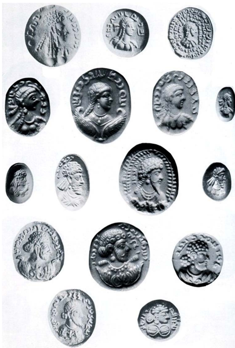
تصویر ۲. مهرهای صاحب‌منصبان ساسانی با تصاویری از زنان و مردان.