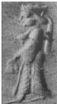
تصویر ۳. مهر هخامنشی (غیبی، ۱۳۸۵: ۱۴۱)