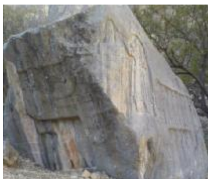
تصویر ۵. کلاه نواردار اشکانی، تنگ سروک