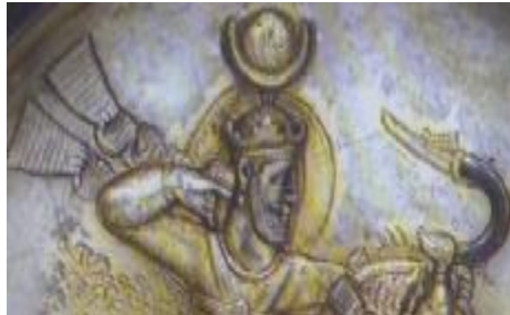
تصویر ۱۳. بخشی از بشقاب سیمین زراندود قلم‌زنی شده در موزه متروپولیتن نیویورک امریکا، پادشاه ساسانی (فیروز یا قباد اول) در حال شکار قوچ، اواخر قرن ۵ میلادی (محمدپناه، ۱۳۸۶: ۱۹۷)