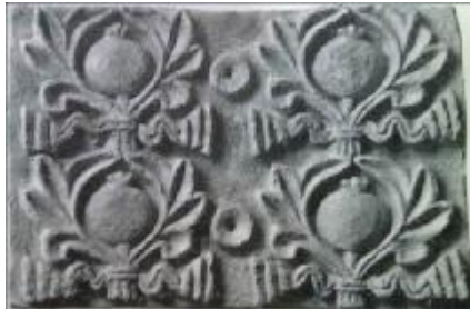
تصویر ۱۴. لوح ملاط گچی از کیش، اتارها در برگ نخل با رویان بسته‌بندی شده‌اند (فریه، ۱۳۷۴: ۷۲).