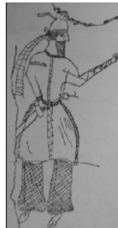
تصویر ۱۰. تخت جمشید، نقش راست: شاهپور بابکان؛ نقش چپ: بابک (هرتسفلد، ۱۳۸۱: ۳۱۳، ۳۱۵)