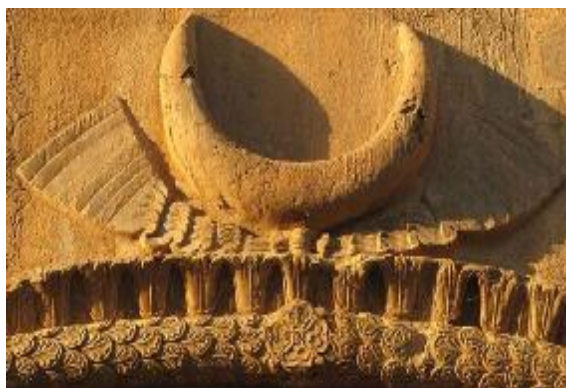
تصویر ۱۵. تاق بزرگ بستان، هلال ماه نواردار بر فراز غار (فریه، ۱۳۷۴: ۷۴)