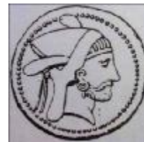
تصویر ۹. سکه‌های حاکمان پارس، از راست: بغدات، هویرز، اردشیر اول و اوتوفرادات اول، (حدود ۲۵۰ ق م - ۲۰۰ ق م) (سرفراز و آورزمانی، ۱۳۷۹: ۸۰)