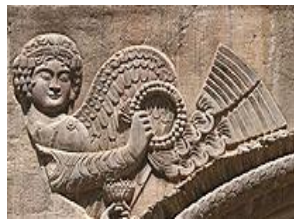
تصویر ۱۱. تاق بزرگ بستان، نیم تاج در دست الهه پیروزی یا نیکه (فریه، ۱۳۷۴: ۷۴)