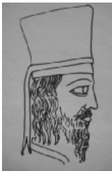
تصویر ۲. نقش بزرگزاده هخامنشی روی سکه (رحیمی، ۱۳۸۵: ۲۰۹)