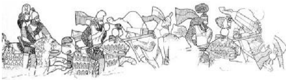
تصویر ۱۷. فیروزآباد، فارس؛ از راست: اردوان پنجم در حال واژگونی، اردشیر اول، وزیر پارتی در حال واژگونی، شاپور اول، سربازی ساسانی گردن سربازی پارتی را با دست گرفته‌است (هرتسفلد، ۱۳۸۱: ۳۱۴).