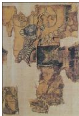
تصویر ۱۶. پارچه ابریشمی با نقش قوچ نواردار، آنتیگونه، مصر، قرن ۶ میلادی (Harris, 2004: 69)