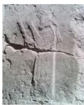
تصویر ۴. نقش فراه‌داره (هرتسفلد، ۱۳۸۱: ۲۹۲)