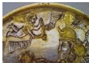
تصویر ۱۲. بخشی از بشقاب سیمین زراندود در موزه مهیو ژاپن، الهه پیروزی نیم تاج را برای پادشاه ساسانی (احتمالاً قباد اول) که در حال شکار شیر و گراز است، می‌برد (محمدپناه، ۱۳۸۶: ۱۹۴).