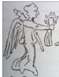
تصویر ۷. سکه اشکانی، نیکه (هرتسفلد، ۱۳۸۱: ۳۰۴)