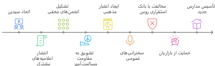
تأثیر اتحاد سیدین بر انقلاب مشروطه

مطلقه به مشروطه انجامید که خود سرآغاز تغییرات سیاسی و اجتماعی گسترده در ایران بود. (نفیسی، ۱۳۵۵: ۴۳۷-۴۳۵)